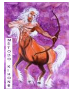
DIAGRAMA DO MÉTODO KIRON®